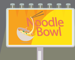
การประชาสัมพันธ์